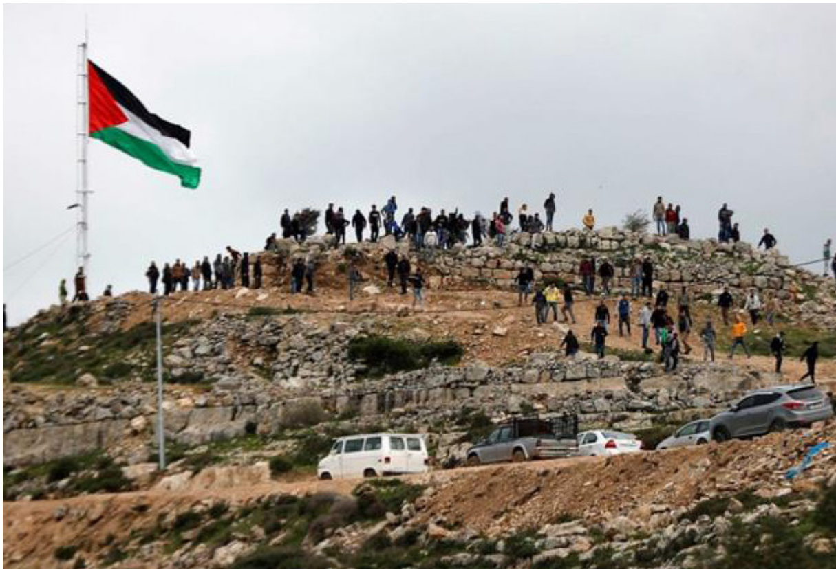
جبل العرمة من أراضي بلدة بيتا «محافظة نابلس» وتحاول سلطات الإحتلال السيطرة عليه.