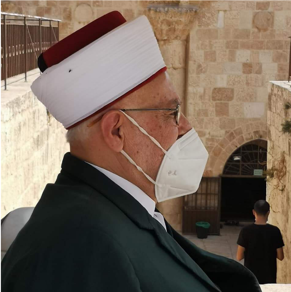
لحظة دخول سماحة الشيخ د. عكرمة سعيد صبري رحاب المسجد الاقصى المبارك لالقاء خطبة الجمعة يوم ٣٠ / ١٠ / ٢٠٢٠م بعد منع استمر مدة ثمانية اشهر